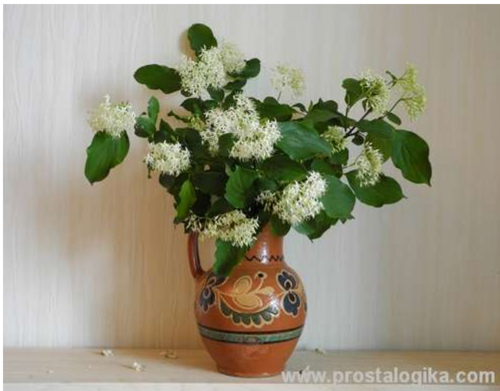
Приклад, коли підходить горизонтальний формат.

Відмічені щойно крайні точки дуже важливі і краще добре прикинути, чи все ляже на свої місця і коли щось не так, то на цьому початковому етапі щенічого не варто містити обрис зображення.