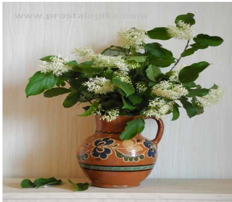
Приклад, коли краще взяти вертикальний формат.